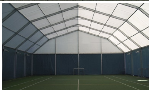
Polygonal aluminum frame