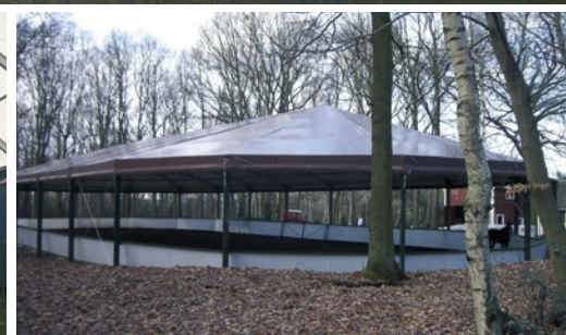
Horse riding school